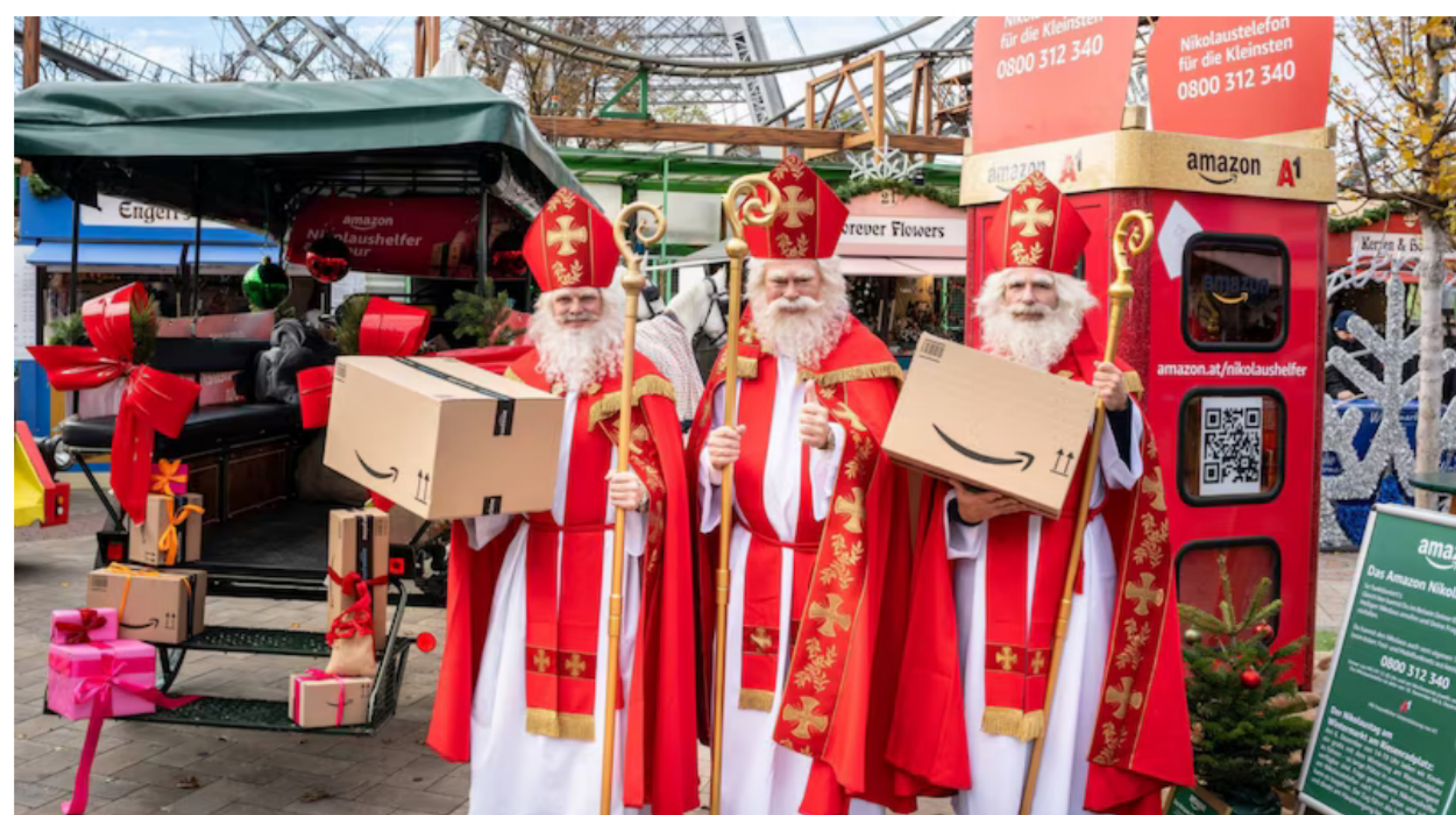
Wer Besuch von einem der prominenten Nikolohelfer bekommen möchte, sollte nicht zögern, sondern sich bewerben!

Zu gewinnen gibt's bei der lieben Aktion nämlich einen von 100 Nikolausbesuchen in Wien, St. Pölten, Salzburg, Graz und Linz. Und unter die Helferlein haben sich sogar ein paar Promis gemischt: So könnte bald nicht nur Toni Polster, sondern auch Thomas Morgenstern oder Dirk Stermann bei Ihnen und Ihrer Familie die Nikolosackerln vorbeibringen.