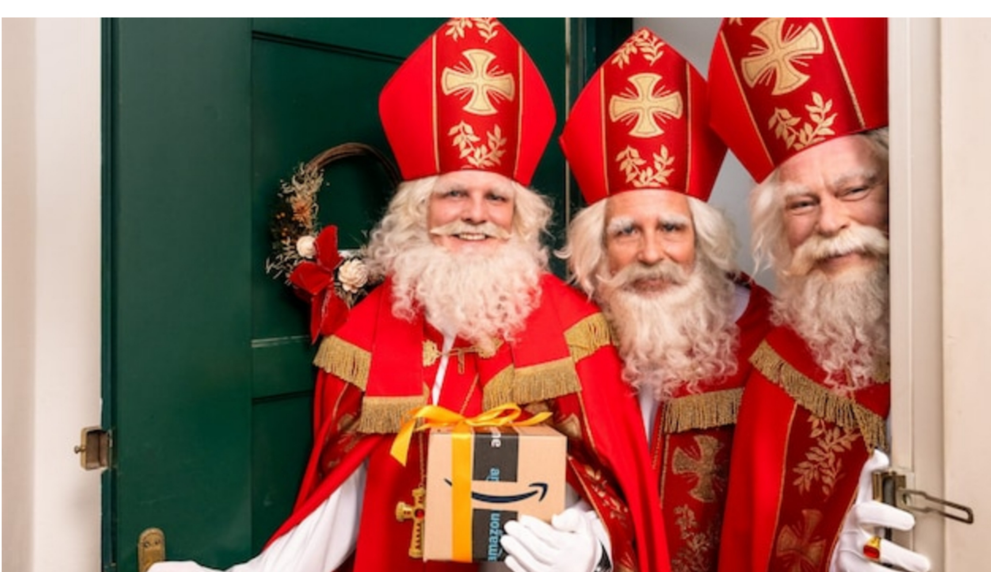
Die Promi-Nikoläuse Thomas Morgenstern, Dirk Stermann und Toni Polster könnten heuer auch bei Ihnen und Ihrer Familie vorbeischaun.

Gleich drei prominente Nikolauhelfer bereiten sich schon emsig auf ihren Einsatz ein. Denn dank Amazon könnten im Advent Fußball-Legende Toni Polster, Ex-Skisprung-Weltmeister Thomas Morgenstern oder Kabarettist Dirk Stermann vor Ihrer Tür stehen.